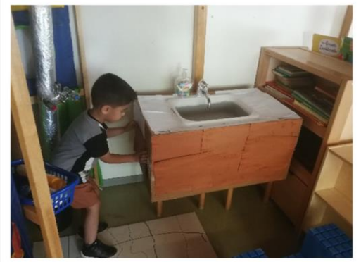
De groep 1-2 G hebben als thema de badkamer. Hier is groep geel heerlijk aan het spelen onder het zelfgemaakte douche-, bad-, wastafelmeubel