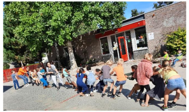
Touwtrekken; wat een kracht en wat een lol

Sinds de start van dit schooljaar mogen de kinderen tijdens de TussenSchoolseOpvang (TSO) kiezen uit een drietal extra activiteiten op het plein. Deze spellen zorgen telkens voor iets nieuws om te beleven en zorgen voor nog meer speelplezier en betrokkenheid bij de kinderen.