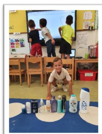
Flessen shampoo neerzetten van GROOT naar KLEIN