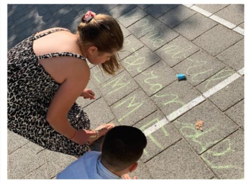
Spelling oefenen op het schoolplein groep 6