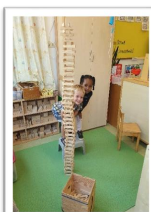
Spelen met Kapla groep 1-2 rood