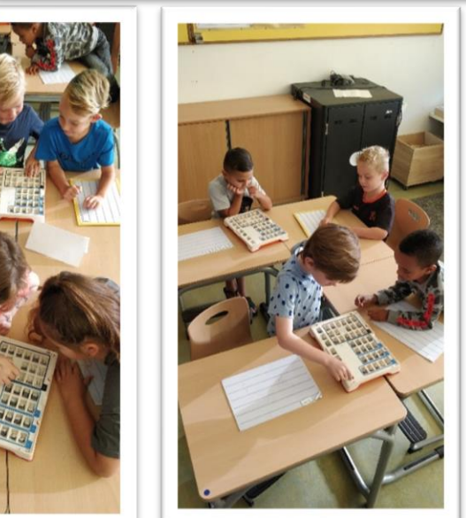
Eerste dictee met de letterdoos in groep 3B