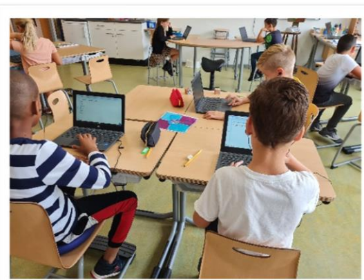
De eerste weektaak van groep 5 op het Chromebook