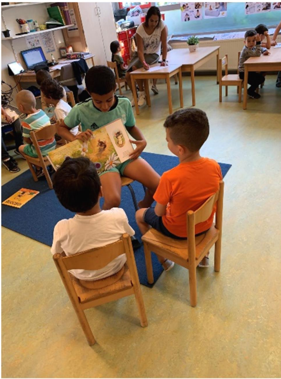
Leerlingen uit groep 6 hebben voorgelezen bij de kleuters