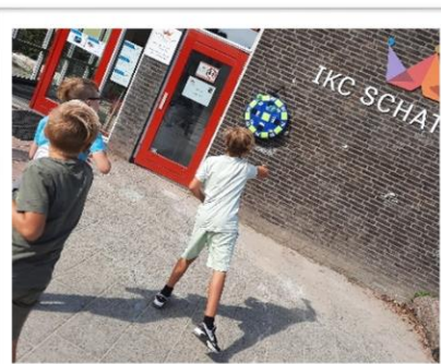
'Darten' met klittenband balletjes

Mocht u het ook leuk vinden om het TSO team als vrijwilliger te versterken dan bent u van harte welkom